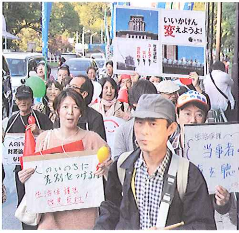
2012年10月20日、東京都港区での生活保護改悪反対などを訴えるデモ

憲法25条の「誰もが人間らしく生きる権利」(生存権)とそれを保障する国の責任を放棄しようとしています。